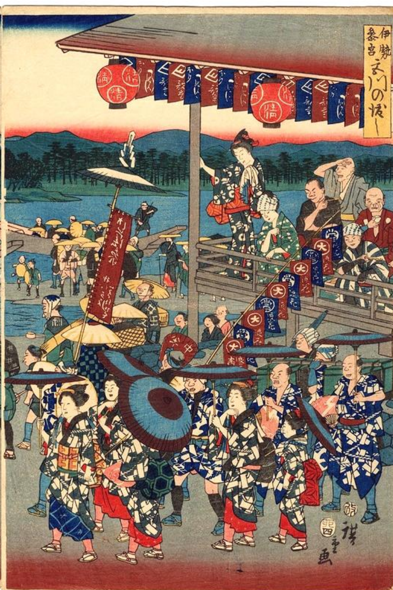
伊勢参宮